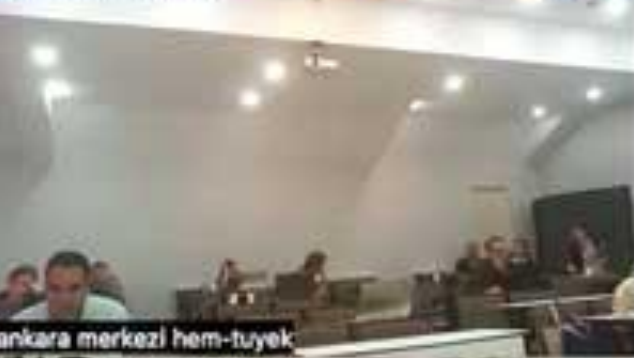
Ankara merkezi hem-tuyek